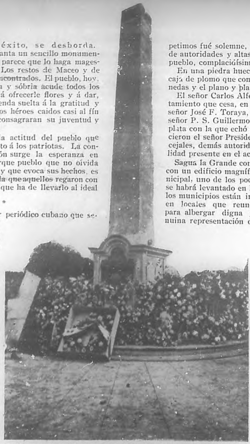
Monumento á Antonio Maceo y Francisco Gómez, en el Cacahual.

petimos fué solemne, y honrado con la asistencia de autoridades y altas personalidades y de todo el pueblo, complacidos por el comienzo de la obra.