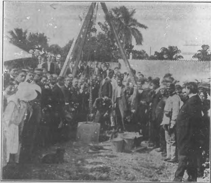
Fotografía tomada en el acto de la colocación de la primera piedra del que será Palacio Municipal de Sagua la Grande, acto que tuvo efecto, con toda solemnidad, el día 1o del presente mes.

Nosotros nos felicitamos de estas corrientes de inmigración artística que, con las de braceros, son las que engrandecen los pueblos formando su cuerpo y su espíritu. La República Argentina es un ejemplo elocuente de lo dicho.