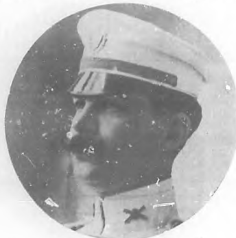
Teniente Coronel Enrique Quiñones

tautación, á las muchas que anoche recibieron tan simpáticos novios, que en su nuevo estado han de disfrutar de las venturas y dichas á que son acreedores.