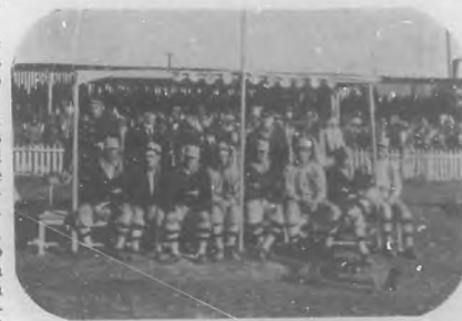
Los Jugadores del "Philadelphia"

Arquitecto de la Ciudad reelecto Presidente de la Sociedad de Ingenieros y Arquitectos de Cuba.